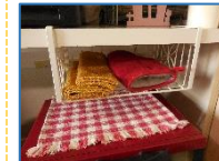
(写真上) 棚吊りバスケット