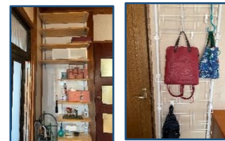
↑棚 ↑突っ張りラック