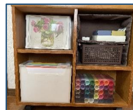
←正面からモノをずらして横から見たところ 右上はふたつ重ねたボックス→

モノの縦、横、奥行の3辺いずれかが収納スペースのサイズにどこかに合っていると意外な形で収まります。