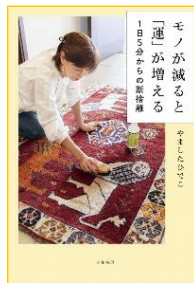
モノが減ると「運」が増える