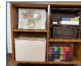
←正面からモノをずらして横から見たところ 右上はふたつ重ねたボックス→

モノの縦、横、奥行の3辺いずれかが収納スペースのサイズにどこかに合っていると意外な形で収まります。