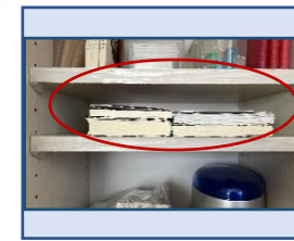
←本を横にファイルボックスを縦に→