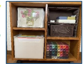
←正面からモノをずらして横から見たところ 右上はふたつ重ねたボックス→

モノの縦、横、奥行の3辺いずれかが収納スペースのサイズにどこかに合っていると意外な形で収まります。