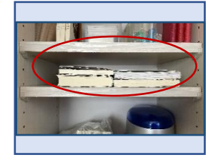
←本を横にファイルボックスを縦に→