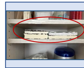
←本を横にファイルボックスを縦に→