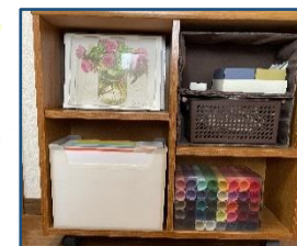
←正面からモノをずらして横から見たところ 右上はふたつ重ねたボックス→

モノの縦、横、奥行の3辺いずれかが収納スペースのサイズにどこかに合っていると意外な形で収まります。